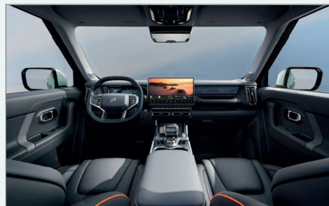
Black & Orange